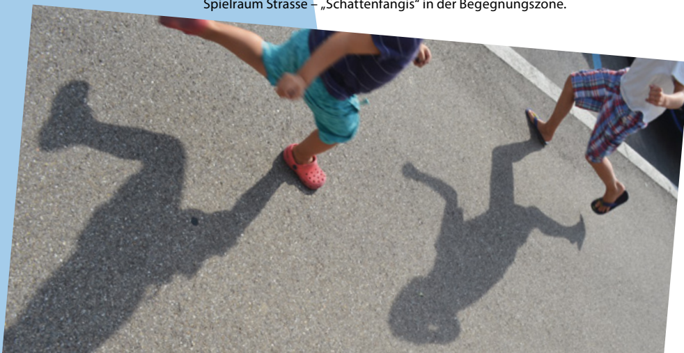
Spielraum Strasse – „Schattenfangis“ in der Begegnungszone.

Wir unterstützen die Kinder bei der Verwirklichung ihrer eigenen Anliegen und Ideen.