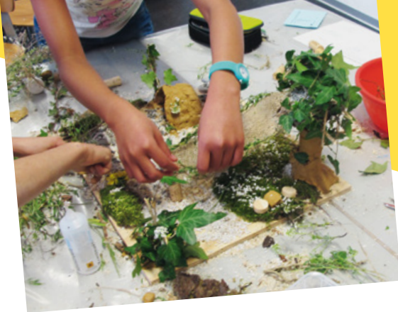
Planungswerkstatt Spielplatz – Kinder bauen ihre Ideen.

Wir entwickeln und führen Projekte mit Kinderbeteiligung durch.